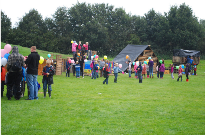
Een overzicht van een aantal hutten.