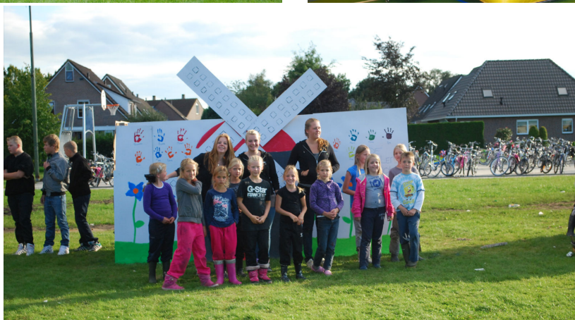
De winnaars van deze spelweek met een prachtige windmolen.