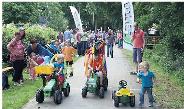
▲ Rondom de viering van tweehonderd jaar Nieuw-Schoonebeek worden veel activiteiten georganiseerd, zoals zaterdag deze Trap-TrekkerTrek-wedstrijd.