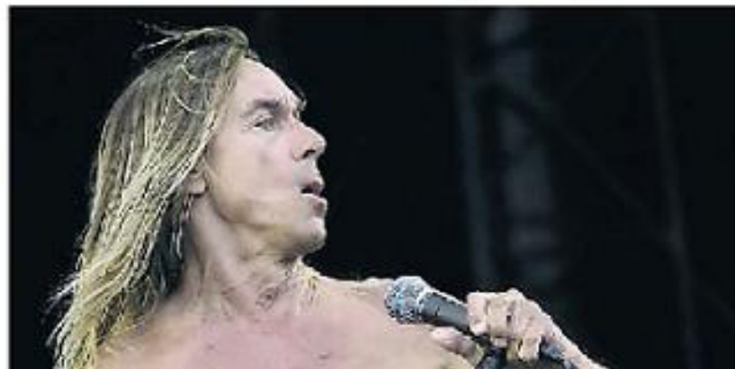
▲ Voor Iggy Pop werd zelfs de plaatselijke tandarts opgetrommeld.