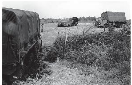
▲ Het leger muurvast in het veen bij Nieuw-Schoonebeek, in juli 1971.

Schepers: „Een domme fout, maar het leverde het dorp een mooi blijspel op. Het publiek vermaakte zich kostelijk.”