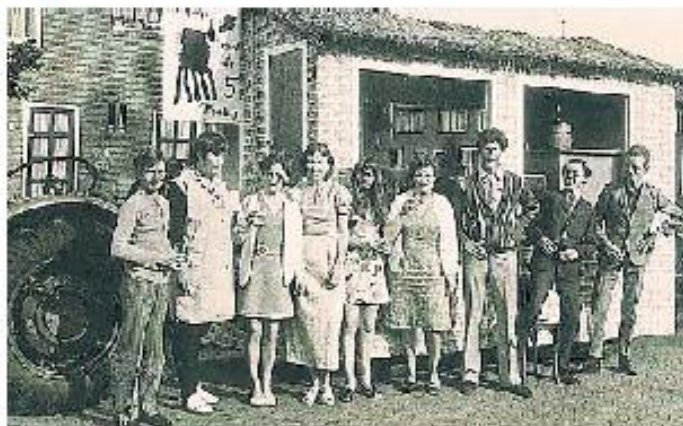
▲ Het volksfeest begin jaren 70.

Huidig bestuurslid Saskia Schnoing (39) zegt dat het Volksfeest met steeds meer veiligheidsmaatregelen te maken krijgt. Dit kost een hoop extra geld en tijd. „Niet leuk, maar ik begrijp het wel. Ongelukken moet je zoveel mogelijk voorkomen en je moet snel kunnen handelen.” Net als bij de laatste edities kan de Rabobank een week voor het feest in 2015 een telefoontje verwachten. „We hebben een keer gehad dat de pinautomaat al op de eerste feestdag leeg was. Dat moet natuurlijk niet nog een keer gebeuren.”