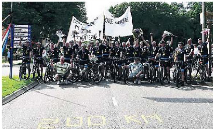
▲ Ter ere van 200 jaar Nieuw Schoonebeek fietsten de Roppers en de Deurtrappers in twee dagen ruim 200 kilometer heen en terug naar het Duitse Tecklenburg.